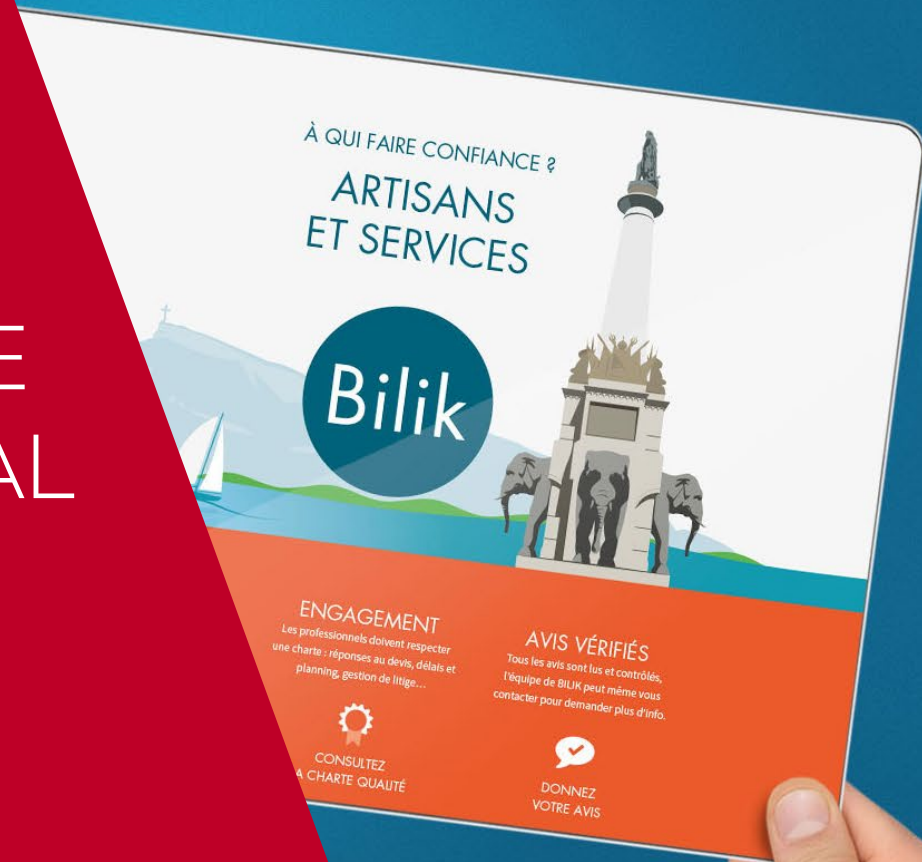
IMAGE DE MARQUE COM' GLOBALE IDENTITÉ VISUELLE DIGITAL